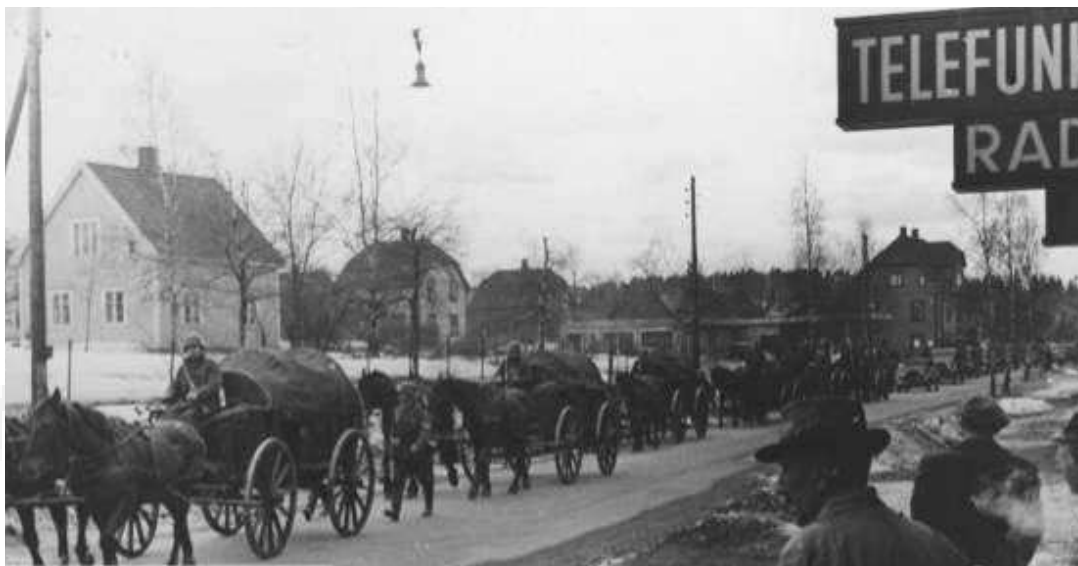
Tyske tropper marsjerer gjennom Strømmen

Når de fem år senere hadde reist hjem igjen ble det bl.a feiret slik på Strømmen Stadion i mai 1945.