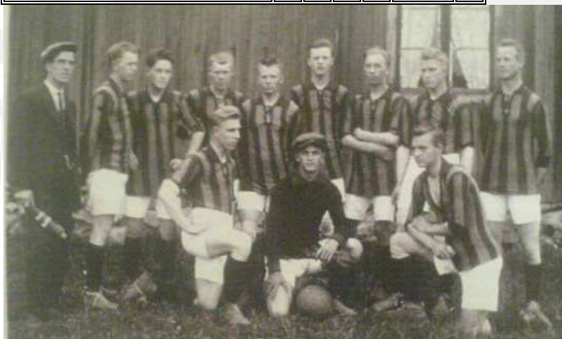
Norrøna en gang på 20-tallet. Draktene var etter det vi erfarer blå og gulstripete med hvite shortser.