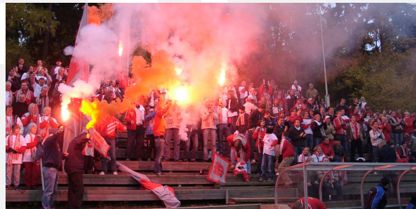
Glade tilskuere etter opprykket.

Det var historien om seniorfotballen i Strømmen Idrettsforening så langt. Nittifem år med fotballhistorie. Lurer på om de ante hva de skulle stelle i stand den guttegjengingen som samlet seg på Losjelokalet på Strømmen den septembermandagen tilbake i 1911.