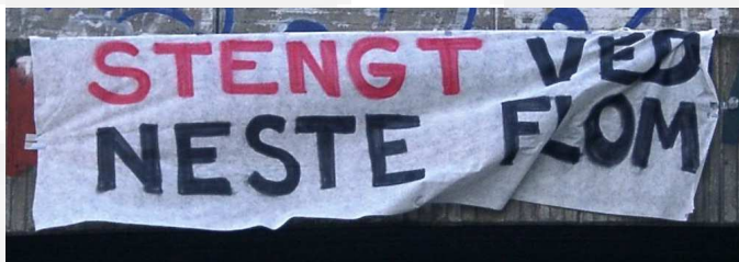
Banner i Sagdalen før cupkampen i 2005.