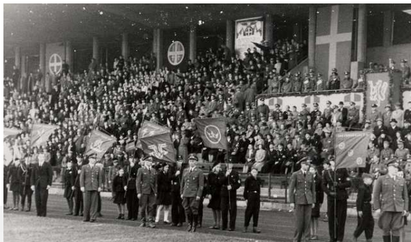
Hvordan okkupasjonsmakten drømte om at idretten skulle være. De reiste hjem i 45.