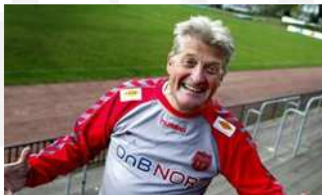
Loffen, mannen som i dag personifiserer rivaliseringen mellom de to stedene og klubbene.

4000 på tredjedivisjonskamp på Strømmen Stadion i 1969 er i hvert fall et tall. De tre cupkampene trakk et sted mellom 2000 og 3000 Romerikinger i årene 1981, 1995 og 2005.