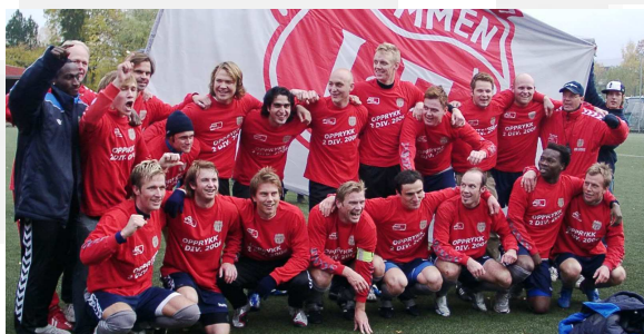
Glade spillere etter opprykket.