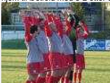
Etter cupkampen mot Sprint/Jeløy

Asker var suverene. Vi måtte nøye oss med litt cupmoro igjen. Fu/Vo og Rælingen ble eliminert i kvalifiseringen før store sterke Sprint Jeløy ventet på Strømmen Stadion i første ordinære runde. En aldri så liten overraskelse og en veldig bra fotballkamp da et av topplagene i divisjonen over ble sendt hjem til Østfold med 5-2 etter ekstraomganger.