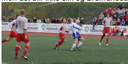
Fra kvalifiseringskampen på Sveum Idrettspark i Brumunddal.

Brumunddal i første kamp på Strømmen Stadion. Det skytes utenfor, keeper redder, det skytes i stengene, det heades over fra tre meter og Dala leder 2-0. Er det mulig... Vi setter en viktig reduisering og er klare for returoppgjøret, dette skal gå veien. Men det gjør ikke det, Dala tar ledelsen mot spillets gang. Når Strømmen tar enda mer over kommer utlikningen. Et mål til nå så er det ekstraomganger. Men det blir ikke slik og Brumunddal tar steget opp i 2. divisjon.